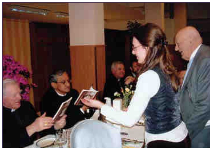
Durante la cena al Bearzi