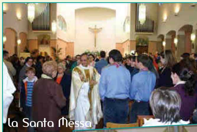
la Santa Messa