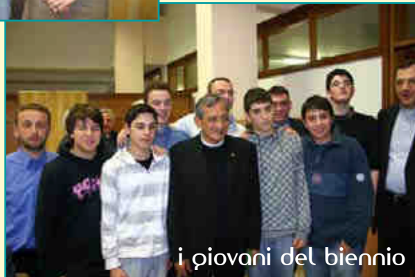
i giovani del biennio