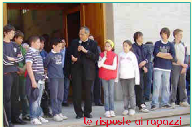
le risposte ai ragazzi