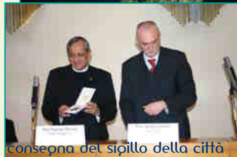
consegna del sipillo della città