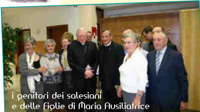
i penitenti dei salesiani e delle Figlie di Maria Ausiliatrice