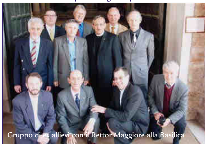
Gruppo di ex allievi con il Rettor Maggiore alla Basilica