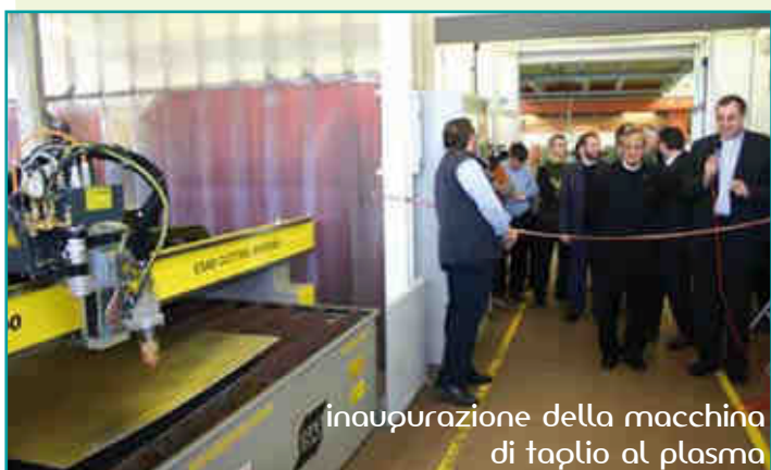
inaugurazione della macchina di taglio al plasma

gazzi del gruppo musicale "Bearzi Band" ed i giovani del Centro di Formazione Professionale e dell'Istituto Tecnico Informatico. "Don Bosco vi direbbe che vi vuole tanto bene e che vi vuole felici... La vita è un dono; è un sogno, una vocazione, una missione; - ha aggiunto - la vita è dura ed esclude che è impreparato; c'è più vita quando si accoglie Gesù. Spesso il problema dei giovani e quello di vivere in un presente senza futuro e senza passato.