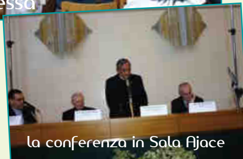
la conferenza in Sala Ajace

Dopo aver visitato, nel primo pomeriggio, la importante basilica patriarcale di Aquileia, il Rettor Maggiore ha presieduto una celebrazione eucaristica alla quale hanno partecipato i parrochiani e gli amici dell'opera salesiana.